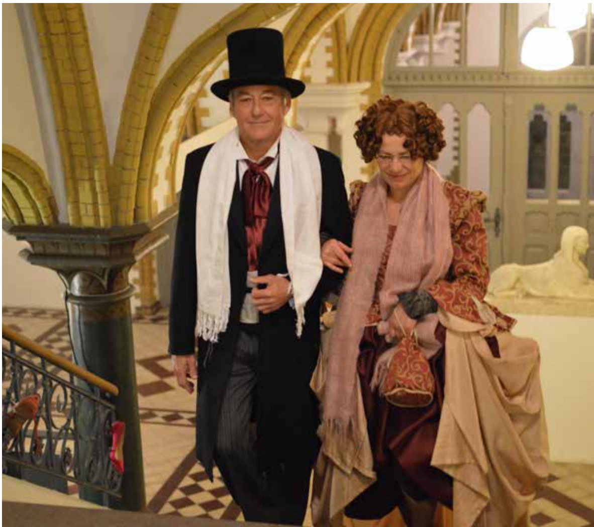
H.C. Andersen projekt