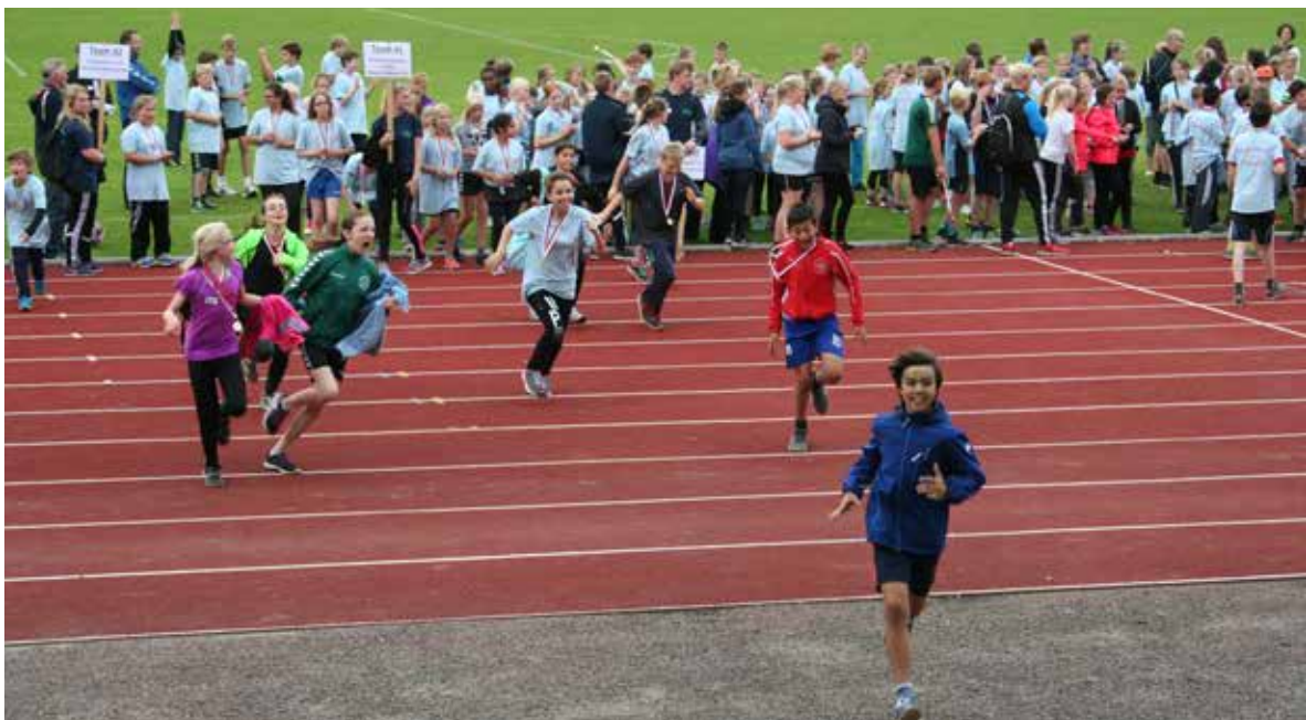
Dansk-tysk skoleidrætsdag, Aabenraa

Den 10. september 2015 blev den 14. dansk-tyske skoleidrætsdag afholdt på Aabenraa Stadion. I dejligt sensommervejr havde ca. 900 danske og tyske elever en rigtig sjov dag med masser af leg og sport. Programmet bød bl.a. på aktiviteter i skoven, crossfit, stomp, terrænleg, aktivitetsplads og høvdingebold. Idrætsforbundene stillede redskaber til rådighed, og elever fra 10. Klasse Aabenraa var en stor hjælp. Ved stævnets afslutning fik eleverne overrakt medaljer, og der var kanonskud at gå hjem på.