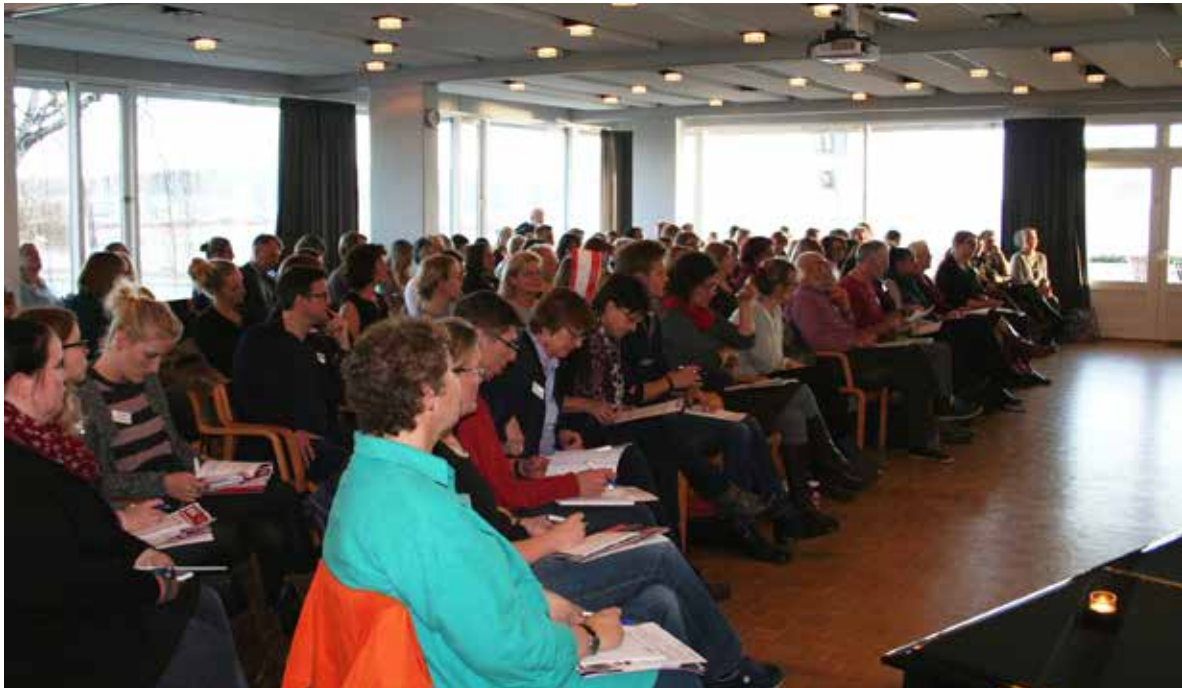
Dansk-tysk lærerkonference, Aabenraa

Den 12. november blev den årligt tilbagevendende dansk-tyske lærerkonference afholdt. Dansk lærere fra Tyskland og tysklærere fra Danmark deltog i konferencen på Højskolen Østersøen i Aabenraa. Konferencens tema var 'Sprog som kulturspejl'. Der blev holdt oplæg om 'Interkulturalitet, multikulturalitet og transkulturalitet', om stereotyper, som projektet SMIK har beskæftiget sig med. Der var præsentation af en emnekasse til brug i tyskundervisningen med kreative sproglege og af det nye Interreg-projekt 'KursKultur'. Forfatter Knud Romer fortalte om sin helt personlige oplevelse af sprog som kulturspejl. Som det også har været tilfældet de foregående år, var alle pladser optaget.