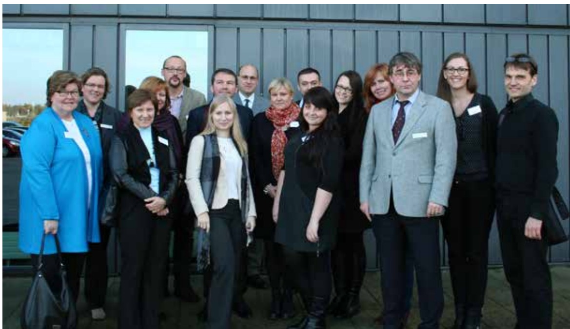
ComUnYouth på besøg i Regionskontor & Infocenter

Projektet 'ComUnYouth' ( combat unemployment among youth ) støttes af Nordisk Ministerråd og organiseres af dets russiske kontor i Sankt Petersborg. Projektet, der startede i 2011, har som mål at bekæmpe ungdomsarbejdsløsheden i de baltisk-russisk-skandinaviske lande. AEBR er netværkspartner, og Region Sønderjylland-Schleswig støtter projektet. Som led i projektet 'ComUnYouth' aflagde 11 gæster fra Rusland, Estland, Litauen, Norge, Finland og Letland besøg i Region Sønderjylland-Schleswig i dagene 11.-12.11.2014 for at høre mere om arbejdskraftens fri bevægelighed her og det vellykkede arbejde, der bliver gjort for at bekæmpe ungdomsarbejdsløshed.