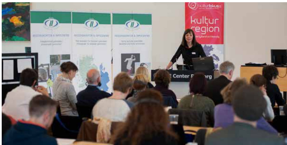
Culture Task Force

muligheder. Derudover var der mulighed for at præsentere projekter og knytte kontakt til kulturaktører fra andre grænseregioner. Både projektet KulturDialog og Kulturaftale Sønderjylland-Schleswig var repræsenteret på den todageskonference og fortalte om Kulturregion Sønderjylland-Schleswig og gav eksempler på det dansk-tyske kultursamarbejde. Kunstnere fra regionen indgik i rammeprogrammet, og som afslutning på konferencen blev der aflagt besøg hos projektet 'Sportpiraten', Schlachthof Flensburg. Christiane Limpers kunstneriske evaluering af arrangementet kan ses på hjemmesiden www.region.de .