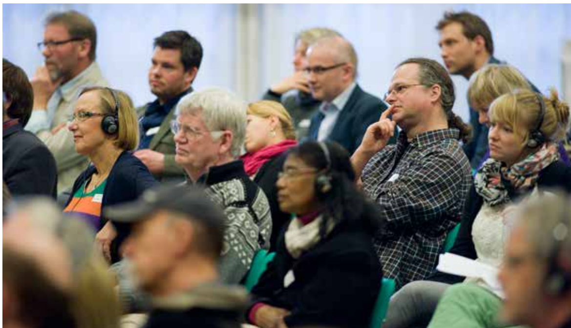
3. Åbne Regionskonference