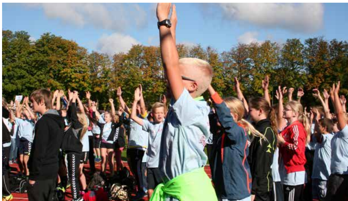
13. Skoleidrætsdag i Aabenraa

Mødet mellem danske og tyske børn bidrager til den interkulturelle forståelse og skal være med til at vække interessen for nabosproget.