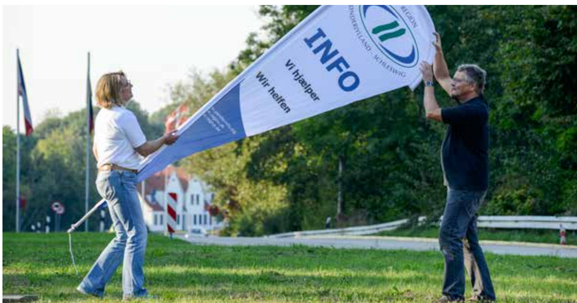
Marketing ved grænsen i Kruså

Afslutningsvis skal det nævnes, at Infocentret også i 2014 har bidraget væsentligt til profileringen af Region Sønderjylland-Schleswig. Infocentret hjælper, hvor det kan, er en neutral instans, og både arbejdstagere og arbejdsgivere og i stigende grad også myndigheder og institutioner benytter det som oplysningskilde.